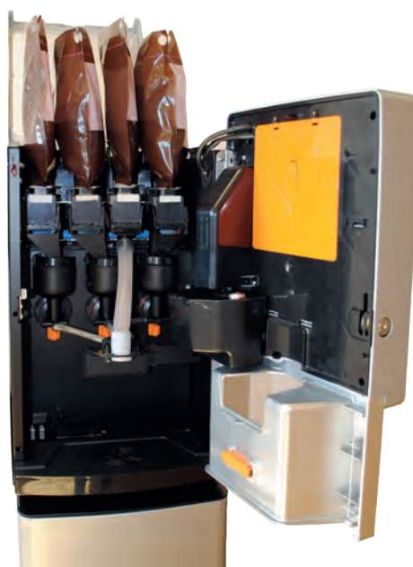
Intérieur du distributeur Cino eC avec les 4 poches en place.

Poche contenant les ingrédients équipé d'une puce contenant la recette, la DLC, le numéro de lot, la date d'emballage, le nombre de doses etc.