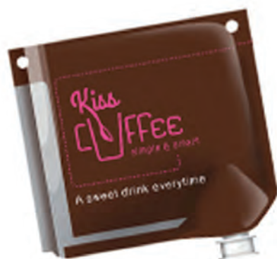
Poche contenant les ingrédients équipé d'une puce contenant la recette, la DLC, le numéro de lot, la date d'emballage, le nombre de doses etc.