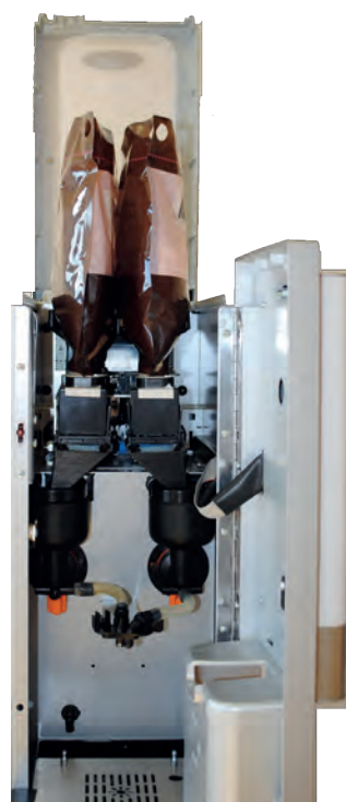
Intérieur du distributeur Lio 2 avec les 2 poches en place et ses 2 bols mixeurs pour plus de flexibilité.