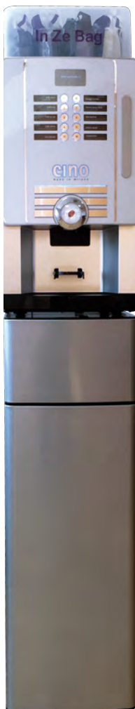
Cino eC sur socle.