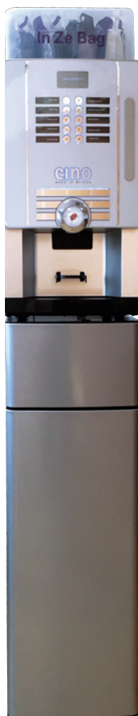
Cino 2e sur socle.